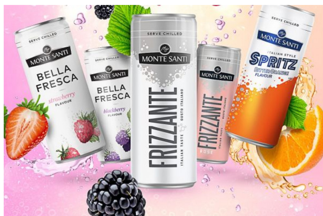
Wina w puszkach to światowy trend, który dynamicznie wzrasta odnotowuje m.in. w Stanach Zjednoczonych.

JNT Group, jeden z liderów branży winiarskiej w Polsce, wraz z rozpoczęciem sezonu wiosenno-letniego wprowadza na rynek wina w innowacyjnych opakowaniach. Niewielkie, poręczne puszkki to sposób na dotarcie do nowej grupy docelowej, a także na zwiększenie trialu zakupowego win marki Monte Santi.